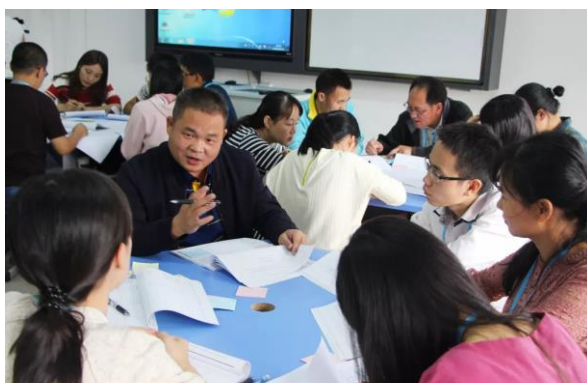
图 4. 地方文化 4 组讨论过程中的经验教训