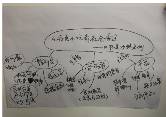
图 11. 从沙糕放大看社会变迁——解释性研究，不可行