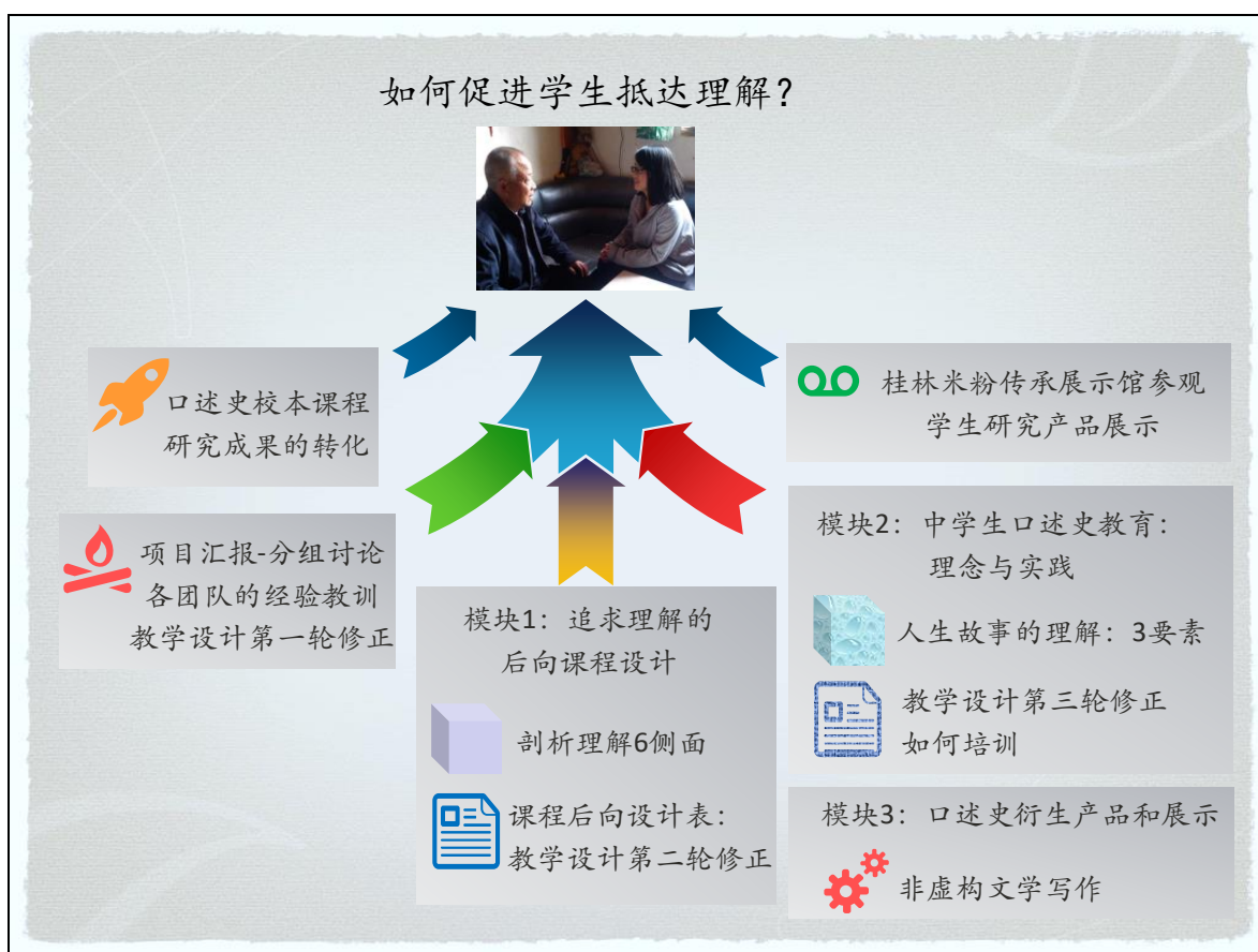
图 1. 工作坊的 6 个内容模块

2018 年 10 月 12-14 日，来自广西、贵州、云南、陕西、甘肃、青海二十余所学校的教师 51 人，学生 2