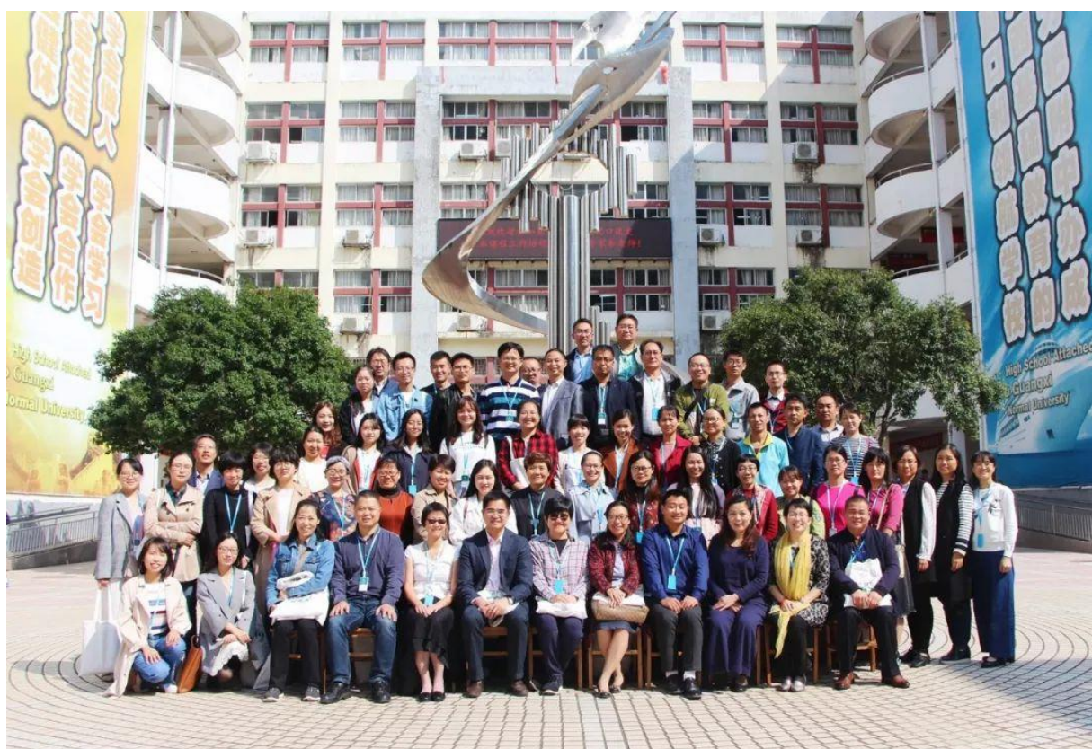
工作坊大合影——成长中的引领者