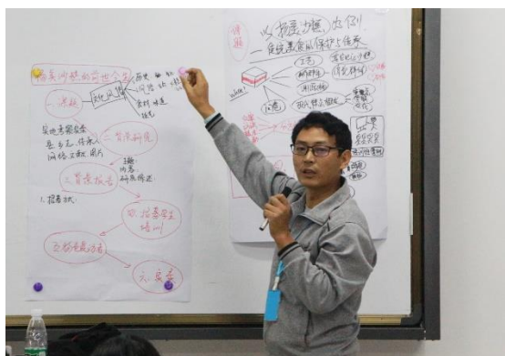
图 10. 地方文化 1 组的研究选题——杨美沙糕相关习俗的描述性研究，可行