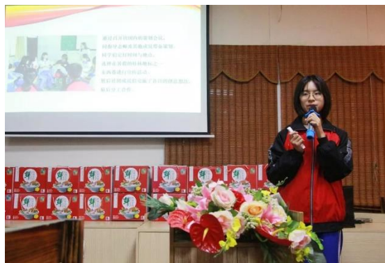
图 15. 桂林米粉项目的初中学生自如又投入的表现让大家眼前一亮