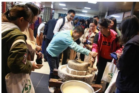
图 14. 学员在体验磨米浆