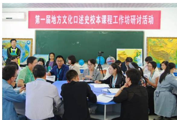
图 3. 足音项目用焦点组访谈的形式展示